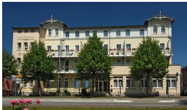
Familienferienstätte St. Ursula, Seeheilbad Graal-Müritz

Die Zeit war so schön, dass wir uns alle einig sind, das war nicht unser letztes gemeinsames Wochenende.