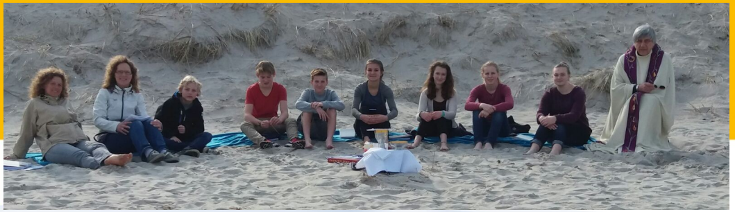
»Familienferienstätte St. Ursula« in Graal Müritz